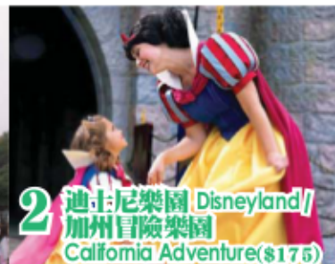
2 迪士尼樂園 Disneyland/ 加州冒險樂園 California Adventure($175)