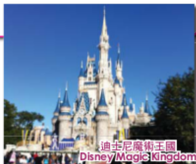
迪士尼魔術王國 Disney Magic Kingdom

四/五/六/七/八/九天團員可於任何時間離開奧蘭度。離開當天除送機服務外，不含任何行程。