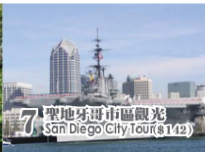
7 聖地牙哥市區觀光 San Diego City Tour ($142)