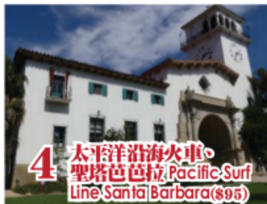
4 太平洋沿海火車 聖塔芭芭拉 Pacific Surf Line Santa Barbara ($95)