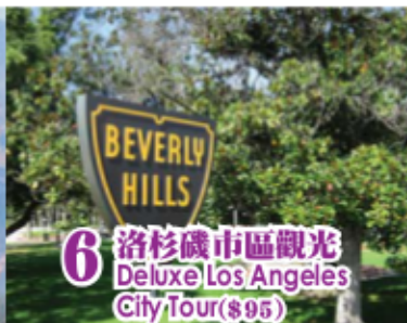
6 洛杉磯市區觀光 Deluxe Los Angeles City Tour ($95)