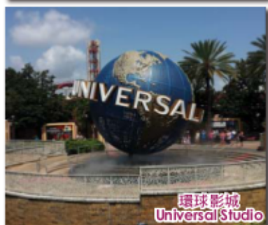
環球影城 Universal Studio