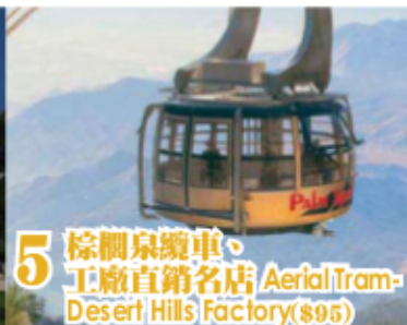
5 棕櫚泉纜車、工廠直銷名店 Aerial Tram - Desert Hills Factory ($95)