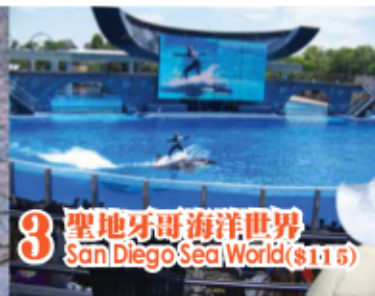
3 聖地牙哥海洋世界 San Diego Sea World($115)