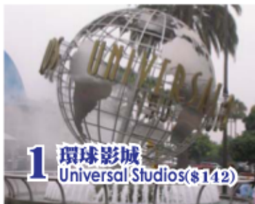
1 環球影城 Universal Studios($142)

For details on the Splendid Tours, please refer to U.S. West Coast 4 ~ 10 Days page 2