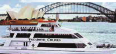
達令港遊船 Darling Harbour Cruise