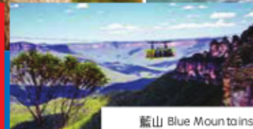
藍山 Blue Mountains

✨航空團 fr$ 1799 起 Tour Fee CAD 1799 起 含澳洲境內機票Incl. Internal flights 贈送SIM卡-無限澳洲境內通話(另含上網) BONUS: Unlimited Calls in AUS w/Data