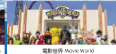
電影世界 Movie World