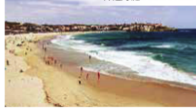
邦迪海灘 Bondi Beach